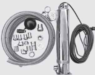
Zubringerpumpe inkl. Zubehör