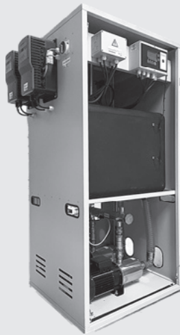
Tano XL Kompaktsystem